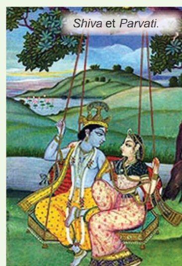
Shiva et Parvati.

Teej est un festival unique pour les femmes. Il est célébré dans certaines parties de l'état de Uttar Pradesh . L'esprit de Teej symbolise « le mariage idéal » mettant en lumière la légende de la déesse Parvati s'unissant au Dieu Shiva après une pénitence de plus