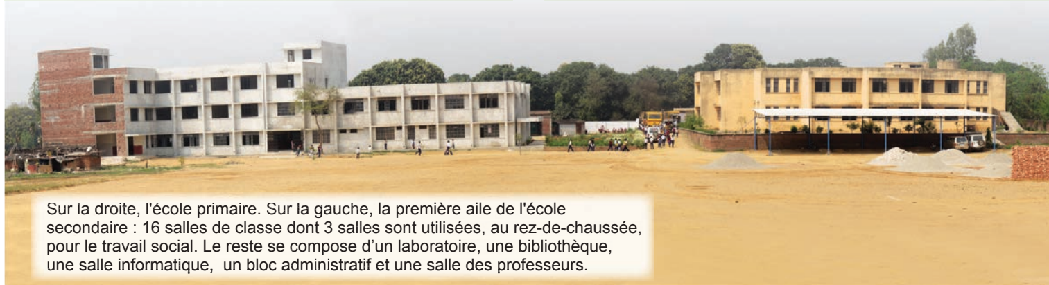
Sur la droite, l'école primaire. Sur la gauche, la première aile de l'école secondaire : 16 salles de classe dont 3 salles sont utilisées, au rez-de-chaussée, pour le travail social. Le reste se compose d'un laboratoire, une bibliothèque, une salle informatique, un bloc administratif et une salle des professeurs.

Bien que nous ayons l'intention de commencer simplement par un rez-de-chaussée, nous prévoyons des fondations permettant l'ajout de deux niveaux.