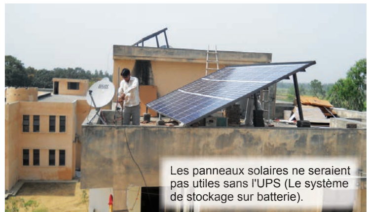
Les panneaux solaires ne seraient pas utiles sans l'UPS (Le système de stockage sur batterie).

Parfois, ici en Belgique, on nous demande pourquoi nous n'installons pas plus de panneaux solaires... Dans notre pays, pendant la nuit, ou lorsque le temps est nuageux, nous pouvons compter sur le réseau électrique public pour fournir l'électricité nécessaire... C'est complètement différent à l'école Saint-Antoine ! L'énergie fournie par les panneaux doit être stockée dans des batteries pour qu'elle puisse être utilisée quand c'est nécessaire. La durée de vie des batteries est de 5 ans. Leur remplacement est une dépense importante.