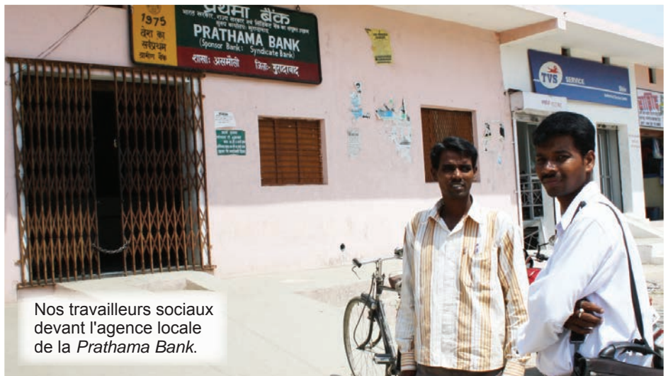
Nos travailleurs sociaux devant l'agence locale de la Prathama Bank.

« Diwali » a été célébrée le 13 novembre dans le nord de l'Inde. Bien qu'il s'agisse d'une fête hindoue, tout le monde y participe avec enthousiasme ! Le mot « Diwali » signifie « rangée de lampes ». C'est en fait