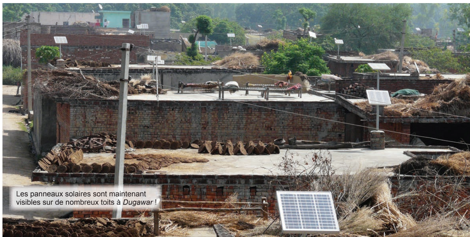
Les panneaux solaires sont maintenant visibles sur de nombreux toits à Dugawar !

Le prix normal de cette installation est de 14.500 roupies (180 euros) et 30 % est donc