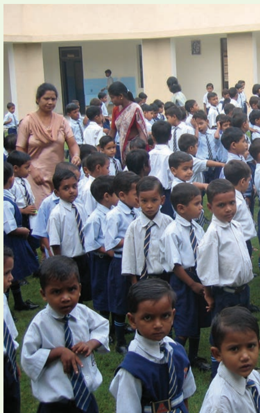
Beaucoup de nouveaux inscrits. Ils sont maintenant 300 à l'école St Antoine...

La seconde année scolaire à l'école Saint-Antoine a débuté le 1 er juillet. Cette année, contrairement à l'année dernière, les parents ont inscrit leurs enfants à l'avance. Comme nous ne pouvions pas accepter tous les enfants, nous avons inscrit ceux qui sont arrivés les premiers ; cependant nous n'avons refusé aucune fille. Comme le nombre de filles inscrites était malgré tout insuffisant, nous avons recherché des filles de familles pauvres. Cette année, le nombre maximum d'enfants par classe est de 45 et nous avons divisé les classes de maternelle en deux sections.